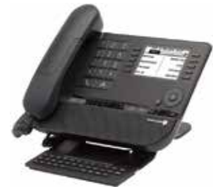
8038 Premium DeskPhone

Unser Unternehmen ist ein führender Anbieter von Kommunikationslösungen und -services für Unternehmen, vom Büro bis hin zur Cloud, die unter der Marke Alcatel-Lucent Enterprise vertrieben werden. Mit weltweit über 2.700 Mitarbeitern in über 100 Ländern und unserem Hauptsitz in der Nähe von Paris, Frankreich, vertrauen wir auf unseren innovativen und unternehmerischen Grundgedanken. Unser Team aus Technologieexperten, Service-Profis und über 2.900 Partnern ist mit Kommunikations-, Netzwerk- und Cloud-Lösungen für Unternehmen aller Größenordnungen für weltweit über 830.000 Kunden da und hilft ihnen, unsere Lösungen und Dienstleistungen an die lokalen Gegebenheiten anzupassen. Gemeinsam mit unseren Partnern erschaffen wir ein individualisiertes Benutzererlebnis, das unseren Kunden und deren Endanwendern greifbare Ergebnisse liefert.