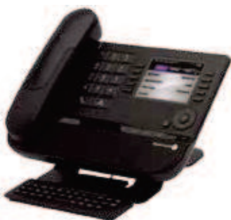
8068 IP Premium DeskPhone