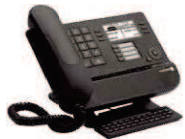
8028 IP / 8029 TDM Premium DeskPhone