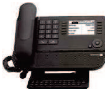
8038 IP / 8039 TDM Premium DeskPhone